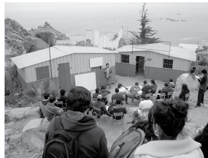
Clases de universidad en campamento Camino al mar, Coquimbo