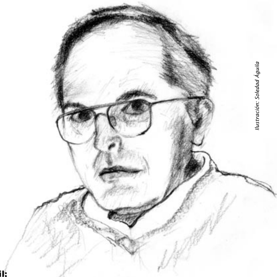
Ilustración: Soledad Águila