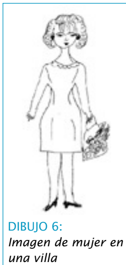
DIBUJO 6: Imagen de mujer en una villa

En el nuevo escenario, los hijos hombres entrañan una doble función que los distancia de sus familias. De una parte, reflejan la frustración de sus padres que no disponen de los medios que quisieran para apoyarles en su desarrollo. Son fuente principal de gasto y angustia familiar. A la par, aunque no equipados para el mercado laboral, son especialmente vulnerables ante la delincuencia, el único medio que les permite acceder al